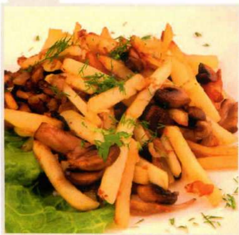
Картофель жареный с грибами