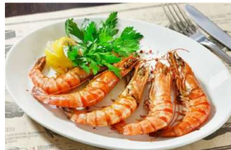
Тигровые креветки на гриле