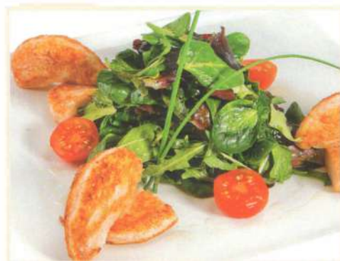
Зелёный салат с запечённым сыром