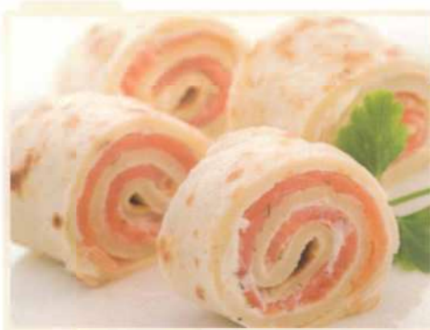
Рулет с сёмгой в лаваше