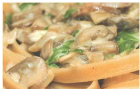
Феттуччини с грибами