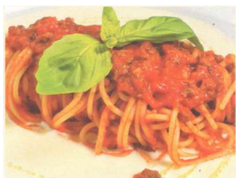
Спагетти с соусом «Болоньезе»