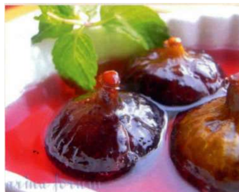
Варенье - Инжир