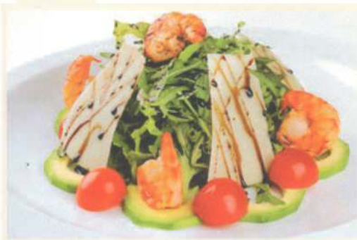
«Руккола с креветками»