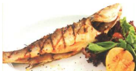
Сибас на гриле