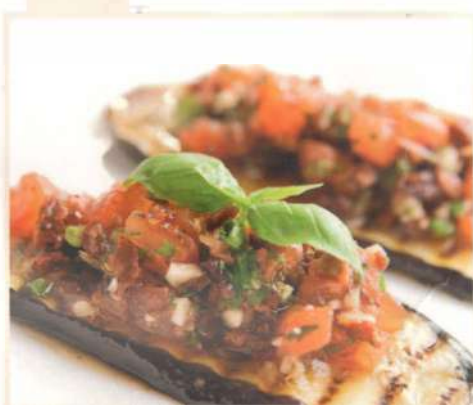
Баклажаны с соусом сальса