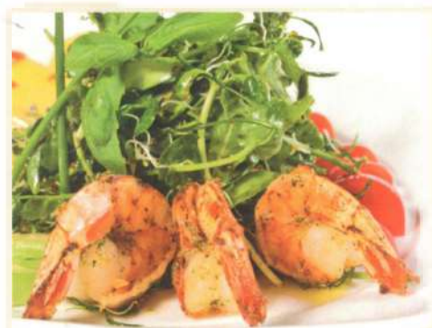
Микс-салат с жареными креветками и моцареллой