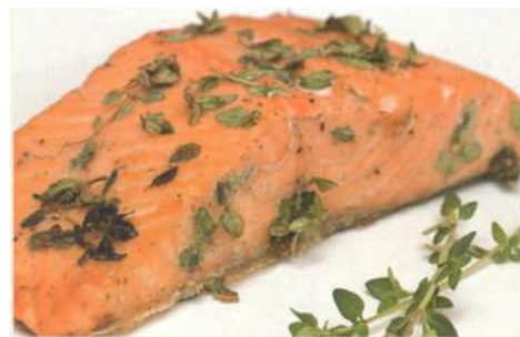
Филе сёмги на пару с овощами