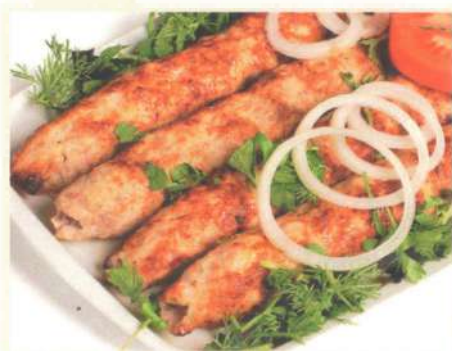
Люля-кебаб из курицы