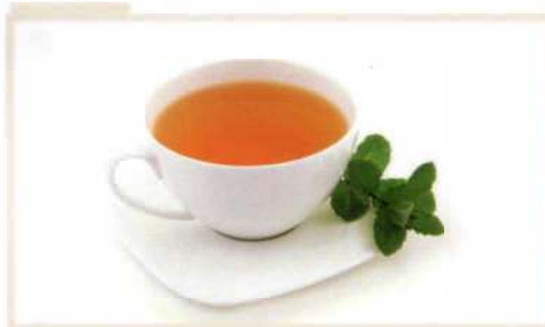
Чай с мятой