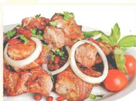
Шашлык из свиной шейки