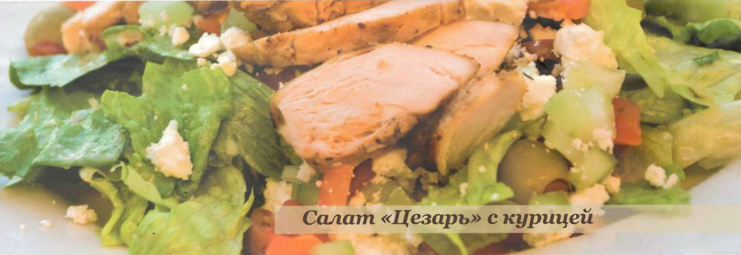
Салат «Цезарь» с курицей