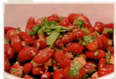
Лобби красное в горшочке