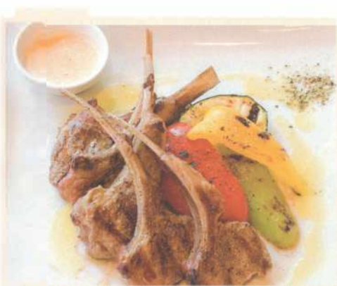
Каре ягнёнка с овощами гриль