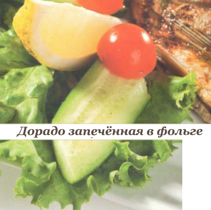
Дорадо запечённая в фольге